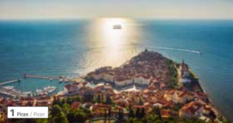
1 Piran / Piran