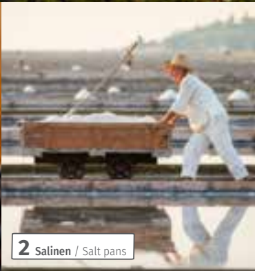
2 Salinen / Salt pans