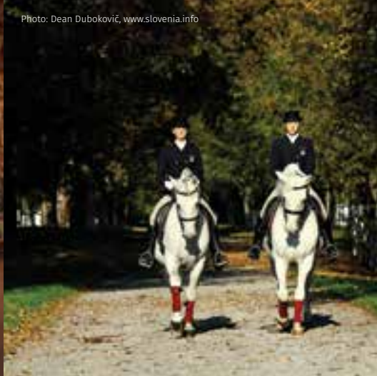
Lipica – Gestüt Lipica