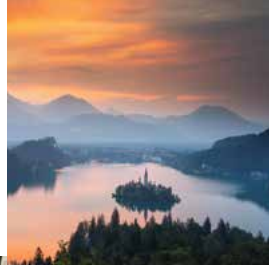
Bled – Bleder See