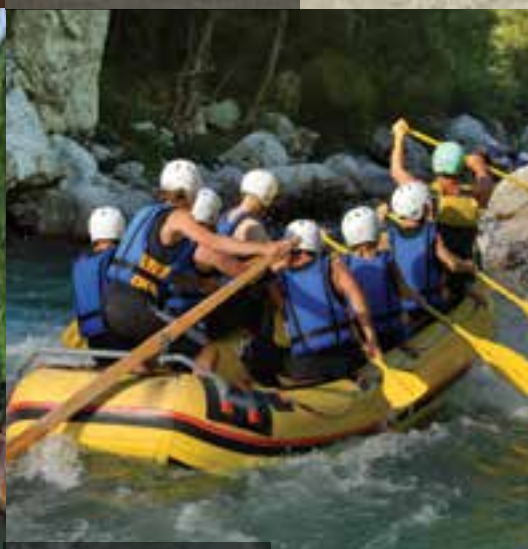
Soča Tal – Fluss Soča