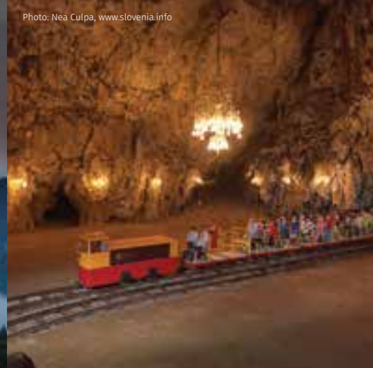
Postojna – Grotten von Postojna