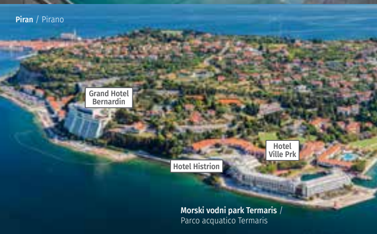
Grand Hotel Bernardin