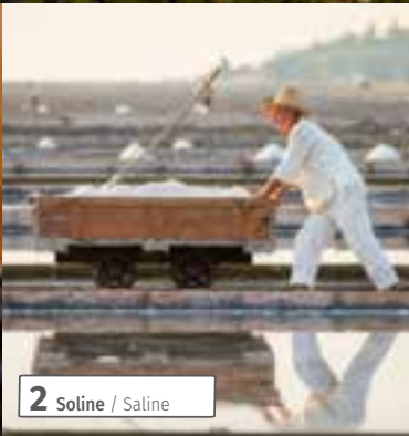
2 Soline / Saline