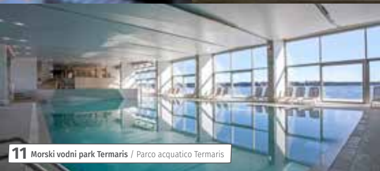
11 Morski vodni park Termaris / Parco acquatico Termaris