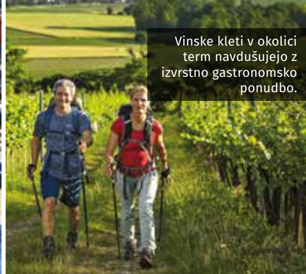
Vinske kleti v okolici term navdušujejo z izvrstno gastronomsko ponudbo.