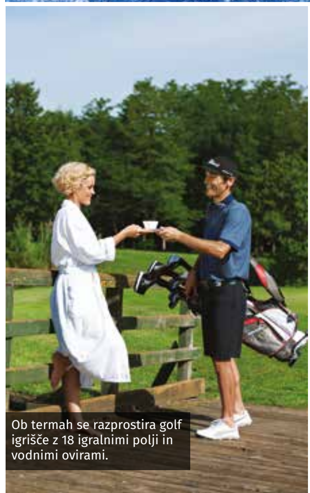
Ob termah se razprostira golf igrišče z 18 igralnimi polji in vodnimi ovirami.