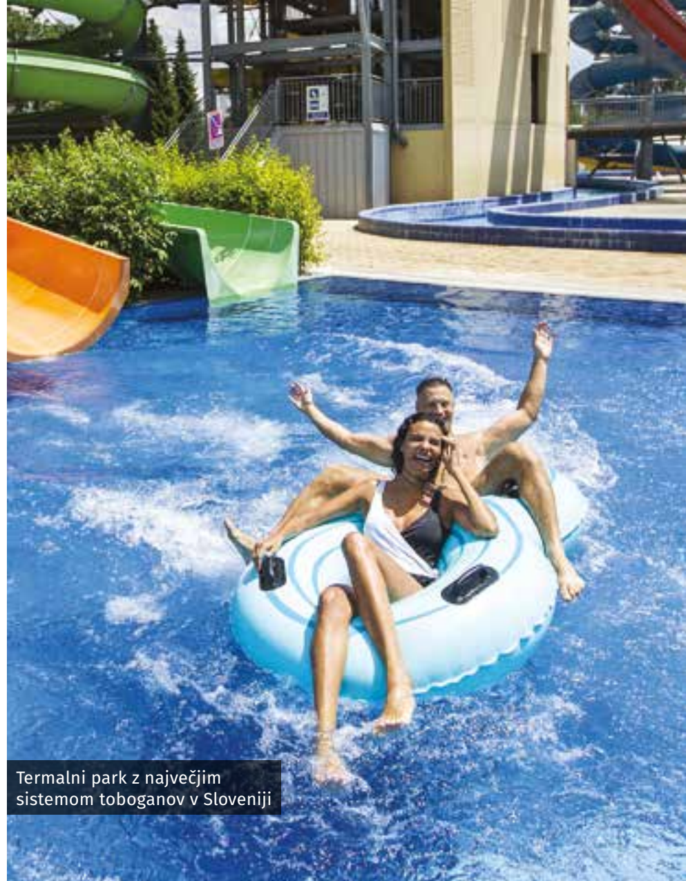
Termalni park z največjim sistemom toboganov v Sloveniji