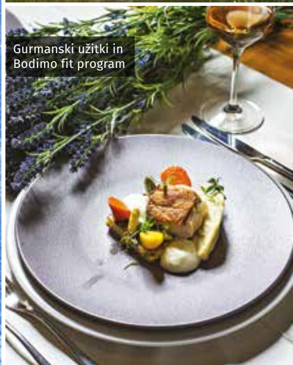
Gurmanski užitki in Bodimo fit program